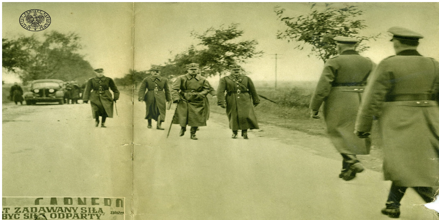
Spotkanie dowódcy obrony twierdzy Modlin gen. Wiktora Thommée (w środku, z laską) i oficerów niemieckich na szosie do Jabłonny w rejonie Suchocina w sprawie ustalenia warunków kapitulacji twierdzy.

https://przystanekhistoria.pl/pa2/tematy/polskie-wojsko/104854,General-Wiktor-Thomme-Ostatni-obronca-Modlina.html