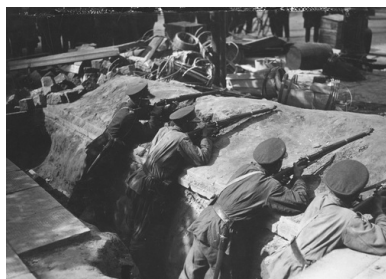
Szwależerowie podczas strzelania z karabinów w okopach na jednej z ulic Warszawy, maj 1926