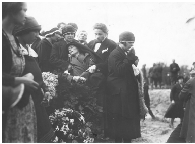
Członkowie rodziny jednej z ofiar przewrotu majowego pogrążeni w żałobie, maj 1926

Realną szansę na sforsowanie Wisły dawało jedynie przejście Trzeciego Mostu (Poniatowskiego), ale Marszałek nie chciał brać na siebie odpowiedzialności za użycie siły. Podległe mu oddziały dostały rozkaz zakazu otwierania ognia aż do chwili, gdy uczynią to żołnierze strony przeciwnej. Powściągliwość zamachowców sprawiła, że przez Trzeci Most mogła przejść Szkoła Podchorążych, wzmacniając tym samym siły rządowe, natomiast próbę jego sforsowania, podjętą przez pododdział Oficerskiej Szkoły Piechoty, powstrzymała „krótka seria w górę z ckm, ustawionego na wieżyczce mostu”. Były to pierwsze strzały, które padły 12 maja. Nie kierowano ich jednak w stronę przeciwnika. Do krwawego starcia, pierwszego podczas zamachu, doszło na Nowym Zjeździe, ogień otwarli zaś żołnierze strony rządowej.