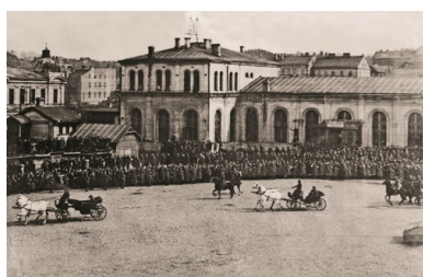
Przyjazd Naczelnika Państwa Józefa Piłsudskiego do Wilna. Powitanie na dworcu kolejowym. Kwiecień 1919 r.

ochotniczym (Freikorps). Z początkiem 1919 r. władze niemieckie wyraźnie jednak zaostrzyły swoją politykę w stosunku do polskiego samorządu, otwarcie wspierając litewskie roszczenia terytorialne. Dzięki temu Litwini usunęli z Sejm polskiego naczelnika i 15 stycznia powołali Litewski Komitet Powiatowy, który kontrolował cały powiat sejneński oraz północno-wschodnią część powiatu suwalskiego wraz z Puńskiem. W styczniu 1919 r. został utworzony litewski oddział milicji, który został uzbrojony w broń odkupioną od Niemców. Aby wymusić wykonywanie poleceń władz litewskich, milicja aresztowała kilku polskich urzędników i usiłowała zastraszyć pozostałych. Pod koniec marca szef niemieckiego zarządu w Suwałkach poinformował przedstawicieli Rady o przekazaniu Suwałk i m.in. powiatu suwalskiego i augustowskiego Litewskiej Radzie Państwowej (Taryba), która została uznana przez władze niemieckie za suwerenną władzę na terenie byłego gubernatorstwa litewskiego. Z początkiem maja do Suwałk wkroczyły oddziały litewskie, a na początku lipca przybyli pierwsi urzędnicy litewscy, którzy usiłowali przejąć administrację powiatu i tworzyć własne instytucje.