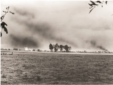
Płonąca wieś pod Warszawą, podpalona przez wojska niemieckie. Wrzesień 1939 r.