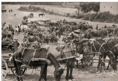
Polskie tabory zagarnięte przez wojska niemieckie. Wrzesień 1939 r.