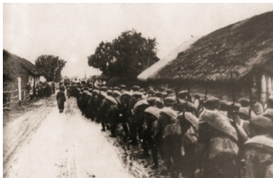
Armia Czerwona wkracza do wioski w rejonie Mołodeczna na Wileńszczyźnie. 17 września 1939 r.

Mobilizacja częściowa, zarządzona 23 marca 1939 r., objęła także część jednostek formacji, m.in. bataliony odwodowe: „Berezwecz”, „Żytyń”, „Snów” i „Snów I”, które po wzmocnieniu przerzucono w rejon: Żywiec–Chabówka–Nowy Targ, gdzie miały zamykać odcinek południowego pogranicza na przedpolu słabej Armii „Karpaty”. Zmobilizowano także osiem szwadronów kawalerii, które po przetransportowaniu w rejon Wielunia utworzyły ćwiczebny pułk kawalerii KOP. Po uzupełnieniu został on przekształcony w 1. Pułk Kawalerii KOP pod dowództwem płk. kaw. Feliksa Kopcia. Zmobilizowano także cztery kompanie saperów KOP („Wilejka”, „Stołpce”, „Stolin” i „Hoszcza”), które przerzucono na pogranicze zachodnie. W kwietniu zostały zmobilizowane kolejne bataliony odwodowe KOP („Wilejka” i „Wołożyn”), które dyslokowano w rejon Żywca. W maju z kompanii wydzielonych z Batalionów KOP „Sienkiewicze” i „Sarny” utworzony został IV Batalion KOP „Hel”, który po przesunięciu na Półwysep Helski przeszedł do dyspozycji Morskiej Obrony Wybrzeża. W lipcu 1939 r. na pograniczu południowym zakończono formowanie 1. Pułku KOP „Karpaty” oraz w trybie alarmowym utworzono 2. Pułk KOP „Karpaty” złożony z Batalionów „Dukla” i „Komańcza”. Batalion KOP „Słobódka” po zmobilizowaniu w kwietniu wraz z baterią artylerii lekkiej KOP „Kleck” został dyslokowany na pogranicze