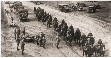
Niemiecka kawaleria i kolumny zmotoryzowane w marszu przez Polskę. XIX korpus gen. Heinza Guderiana. Wrzesień 1939 r.

z Litwą, Łotwą, ZSRR i Rumunią, jednak pogarszająca się sytuacja w stosunkach polsko-niemieckich zmusiła Sztab Główny do zmiany założeń planu i wzmocnienia jednostek armii, przez uszczuplenie sił i przesunięcie części oddziałów KOP w głąb kraju. Ostatecznie po rozpadzie Czechosłowacji i umocnieniu się wpływów niemieckich na Słowacji konieczne stało się wydzielenie części sił KOP do obrony granicy południowej, osłanianej przez słabą Armię „Karpaty”. W maju 1939 r. wprowadzono do planu poprawki zgodnie z założeniem, że Polska nie będzie prowadzić wojny na dwóch frontach. W ochronie Kresów Wschodnich II Rzeczypospolitej miały pozostać jedynie słabsze, odtworzone jednostki KOP, wzmocnione zmobilizowanymi rezerwistami.