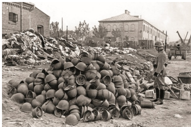
Sprzęt i wyposażenie odebrane polskim jeńcom wojennym. Wrzesień 1939 r.