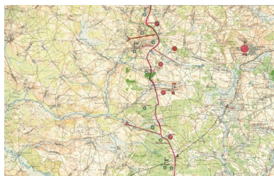
Fragmenc mapy Wojskowego