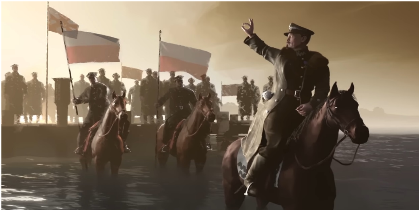
Kadr z filmu IPN „Niezwycięzeni. Czas próby”

https://przystanekhistoria.pl/pa2/tematy/polskie-wojsko/57858,Blekitny-General-w-wojnach-o-granice.html