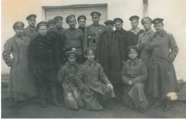
Generał Dowbor-Musnicki w otoczeniu delegatów Rad Robotniczych i Żołnierskich w sztabie I Armii Rosyjskiej w 1917 r.