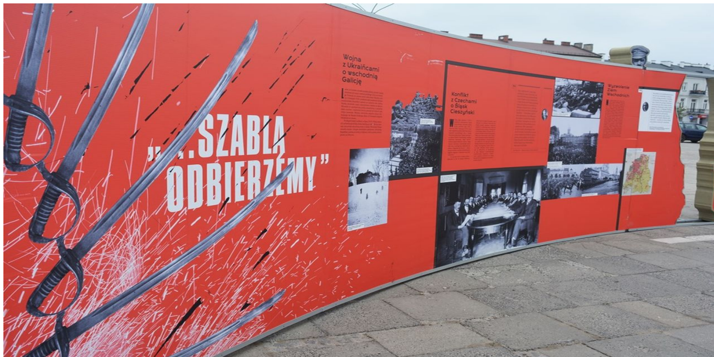
Element wystawy IPN „Powstała, by żyć”, opisujący m.in. konflikt o Śląsk Cieszyński.

https://przystanekhistoria.pl/pa2/tematy/polskie-wojsko/63531,Polsko-czechoslowacki-konflikt-w-1919-r.html