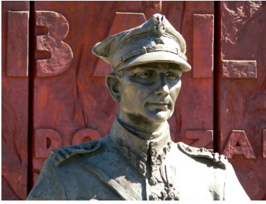
Popiersie majora Hubala w Końskich