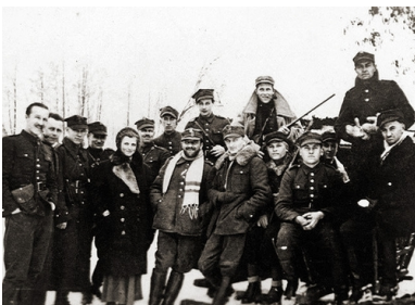
Major Hubal z żołnierzami

Przeprowadzoną przez okupanta niemieckiego akcją represyjną wymierzono bezpośrednio w ludność cywilną zamieszkałą wioski i przysiółki na terenach, na których działał Oddział Wydzielony „Hubala”. Miejscowa ludność dostarczała żołnierzom żywność oraz furaz dla koni, udzielała schronienia, a także przekazywała broń zakopaną w okolicznych lasach we wrześniu 1939 r. Należy podkreślić, że akcja represyjna objęła również swoim zasięgiem wioski, w których Oddział nie kwaterował.