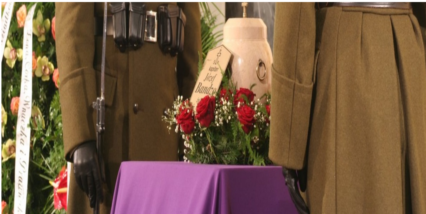
Pożegnanie ppłk. Józefa Bandzo – „Jastrzębia” na Powązkach – Warszawa, 22 października 2016 r.

https://przystanekhistoria.pl/pa2/tematy/polskie-wojsko/70458,Wielki-szczesciarz-Jozef-Bandzo-19232016.html