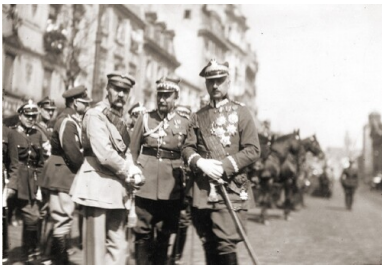
Józef Piłsudski, Tadeusz Rozwadowski, Kazimierz Sosnkowski, 1923 r.