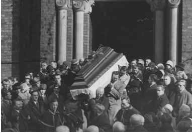
Pogrzeb gen. broni Tadeusza Jordan Rozwadowskiego w Warszawie. Wyniesienie trumny z kościółta św. Barbary na Koszykach, październik 1928 r.