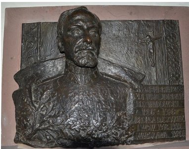
Tablica upamiętniająca gen. Tadeusza Rozwadowskiego w

„Był to prawdziwie chrześcijański, wielki wódz, który umiał zwyciężać bez podniesienia się w pychę i bez pastwienia się nad pokonanym przeciwnikiem, a gdy poniósł klęskę, poniósł ją nie tylko bez upodlenia się, ale nawet bez chęci zemsty i nienawiści do chwilowego zwycięzcy”.