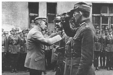
Naczelnik Państwa Józef Piłsudski przed gmachem Sztabu

Po objęciu władzy przez Józefa Piłsudskiego Rozwadowski złożył urząd w związku z różnicą zdań między nim a Naczelnikiem Państwa. Rzec dotyczyła organizacji polskiego wojska.