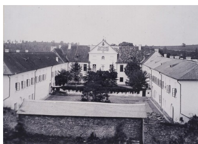
Kompleks klasztoru ss. Niepokalanek w Jazłowcu, koniec XIX w.

Jazłowiec był, podobnie jak dziś, niewielkim ośrodkiem miejskim położonym w malowniczej podolskiej kotlinie. W jego zabudowie wyróżniały się piętnastowieczny zamek fundacji Buczackich oraz klasztor Niepokalanek, wybudowany w 1863 r. przez Marcelinę Darowską, a także zabytkowy kościół oo. Dominikanów pw. Wniebowzięcia Najświętszej Marii Panny, w którym prawdopodobnie spoczął wybitny polski kompozytor doby renesansu Mikołaj Gomółka. To właśnie w pobliżu tego miasteczka na początku lipca 1919 r. skoncentrowało się zgrupowanie ukraińskie, liczące sześć brygad piechoty (ok. 2,5 tys. bagnetów), w tym kilka kureni wyborowych strzelców niżowych.