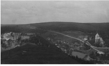
Polska, Jazłowiec (Podole - woj. tarnopolskie). Panorama miejscowości z widocznym kościołem Wniebowzięcia Najświętszej Maryi Panny i ruinami zamku.