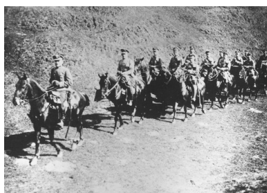
Walki polsko-ukraińskie. Oddział

Ranek i przedpołudnie następnego dnia minęły spokojnie. Obie strony, zmęczone dwudniowym bojem, zachowywały się biernie. Z czasem strona polska przystąpiła do przeczesywania terenu i wyłapywania ukraińskich maruderów. Uderzono też na silne zgrupowanie nieprzyjacielskiej piechoty, które okopało się pod wsią Sadki. Dopiero tutaj Ukraińcy stawili polskiej kawalerii silny opór, ale i tak nie powstrzymali impetu szarży trzech polskich szwadronów. Wydzielone siły 1. Pułku Ułanów dotarły na pozycje ukraińskie nad rzeką Dżuryn. Wzięto do niewoli prawie pół tysiąca jeńców – w tym kilkudziesięciu oficerów – oraz zdobyto osiem karabinów maszynowych. Przeciwnik się wycofał. Bitwa była wygrana. W sumie przez trzy dni w ręce polskie wpadło 1,5 tys. jeńców i spora ilość uzbrojenia.