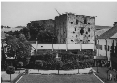
Polska, Jazłowiec (Podole - woj. tarnopolskie). Działanie klasztoru ss. Niepokalanek i ruiny zamku jazłowieckiego. Widok ogólny dziedzińca z figurą Matki Boskiej oraz ruinami zamku w tle.

Pełny sukces odniósł również szwadron rtm. Kazimierza Duchnowskiego z 6. Pułku Ułanów, który natknął się na umocnione pozycje ukraińskie na tzw. Górze Szybińskiej. Po związaniu nieprzyjaciela czołowym ogniem oddział liczący zaledwie 53 oficerów i żołnierzy kilka razy szarżował na wielokrotnie silniejszego, lecz zdemoralizowanego nieprzyjaciela. Po śmierci dowódcy Ukraińcy zaczęli rzucać broń i poddawali się całymi