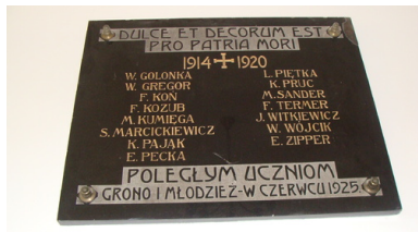
Tablica w Zespole Szkół im. gen. Władysława Sikorskiego w Rudniku nad Sanem, dawnym Państwowym Seminarium Nauczycielskim Męskim.