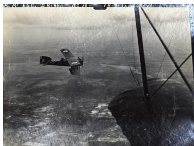
Samolot Bréguet XIVB2 w polskim malowaniu nad Wielkopolską, 14 lipca 1919 r.

w polskim lotnictwie wojskowym. W latach 1925–1939 był m.in. dowódcą II. dywizjonu w 3. Pułku Lotniczym, kwatermistrzem 3. Pułku Lotniczego w Poznaniu, komendantem bazy 6. Pułku Lotniczego we Lwowie (1932–1935) i Centrum Wyszkozenia Lotnictwa nr 1 w Dęblinie (1935–1936), wreszcie (już w randze podpułkownika) zastępcą szefa Kierownictwa Zaopatrzenia Lotnictwa w Warszawie (1936–1939). Wrzesień 1939 roku i napaść nazistowskich Niemiec na Polskę twardego Wielkopolanina bynajmniej nie złamały. Po przedarciu się przez Rumunię do Francji, a po jej upadku do Wielkiej Brytanii, Pniewski objął nad Tamizą stanowisko komendanta Obozu Lotnictwa Polskiego w bazach RAF w Blackpool i Dunholme-Lodge (1940–1945).