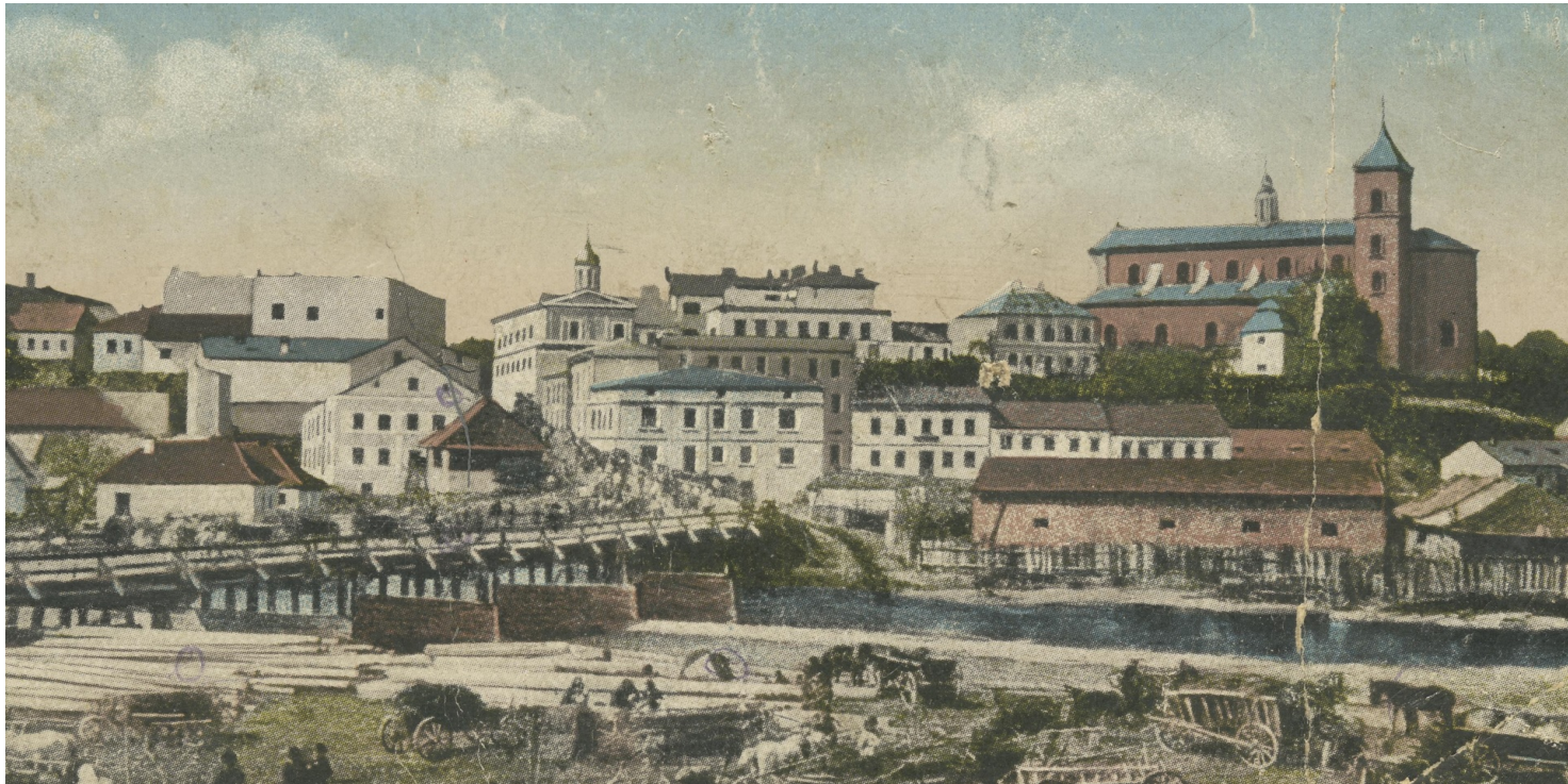
Panorama Gorlic na pocztówce z 1915 r.

https://przystanekhistoria.pl/pa2/tematy/polskie-wojsko/89804,Adam-Switalski-tytularny-general-brygady-AK-wiezien-obozow-NKWD.html