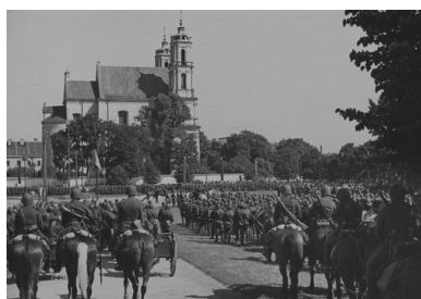
Jubileusz dwudziestopięciolecia 1. Dywizji Piechoty Legionów w Wilnie i piętnastolecia 14. Pułku Ułanów Jazłowieckich we Lwowie Fragment uroczystości na placu Łukiskim w Wilnie, sierpień 1939 r.