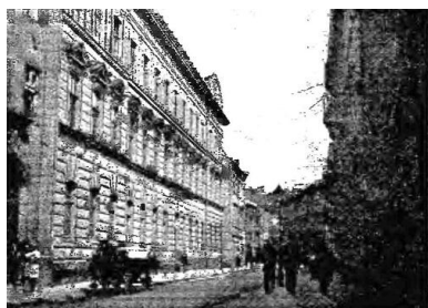
Gmach VII Gimnazjum im. Tadeusza Kościuszki we Lwowie na fotografii sprzed 1934 r.