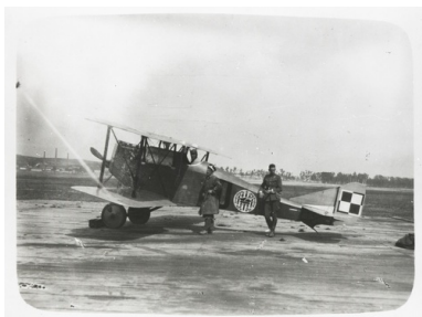
Ansaldo A.1 Balilla o numerze bocznym 10 (nr fabryczny 16739, nr CWL 16.4). W 7. Eskadrze Myśliwskiej od maja 1920 roku.

14 października Amerykanie zjawili się u Józefa Piłsudskiego. Zostali przyjęci dość chłodno. Naczelnik Państwa przyrównał swych gości do najemników. Nie sprzeciwił się jednak ich służbie, wygłaszając słynną frazę Pokażcie co umiecie!