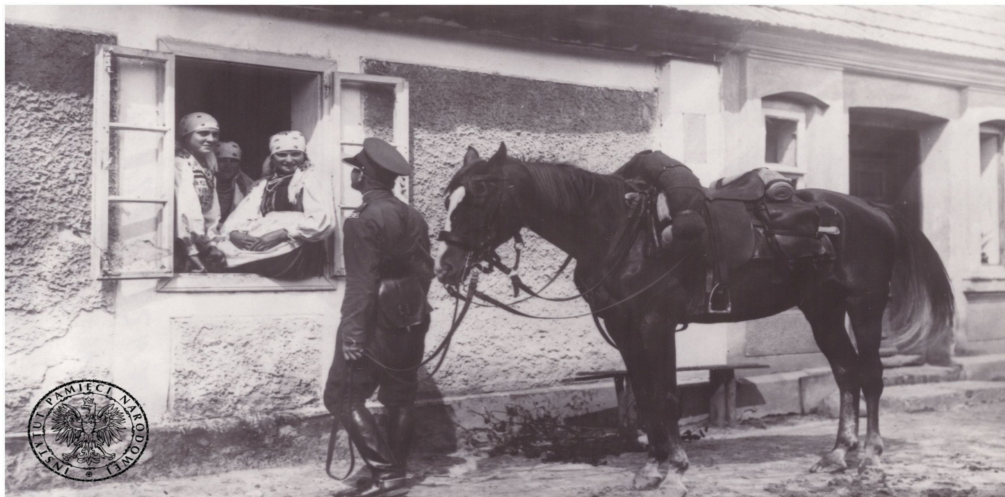
Szwolceży z 1. Pułku Szwolceżerów Józefa Piłsudskiego podczas rozmowy z dziewczętami.

https://przystanekhistoria.pl/pa2/tematy/polskie-wojsko/98583,Kawaleria-II-RP.html