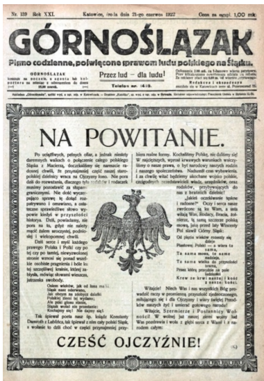
Strona tytułowa „Górnoślązaka” z informacją o wkroczeniu wojsk polskich do części Górnego Śląska, przejętej przez władze polskie, 21 czerwca 1922 r.