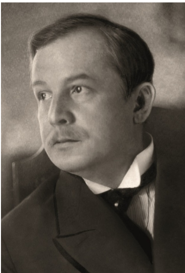
Wojciech Korfanta w okresie plebiscytu.

Niespełna miesiąc przed plebiscytem Korfanta głosił, że „swego tryumfu lud górnośląski jest pewien, jego zwycięstwo jest murowane”. Okazało się jednak inaczej.