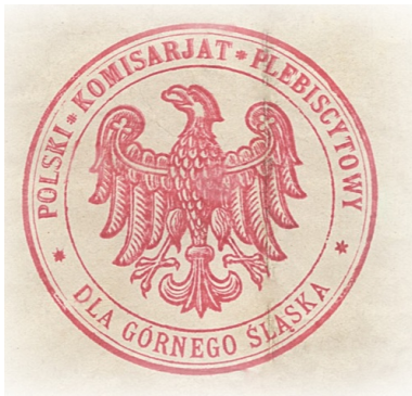
Pieczęć Polskiego Komisariatu Plebiscytowego