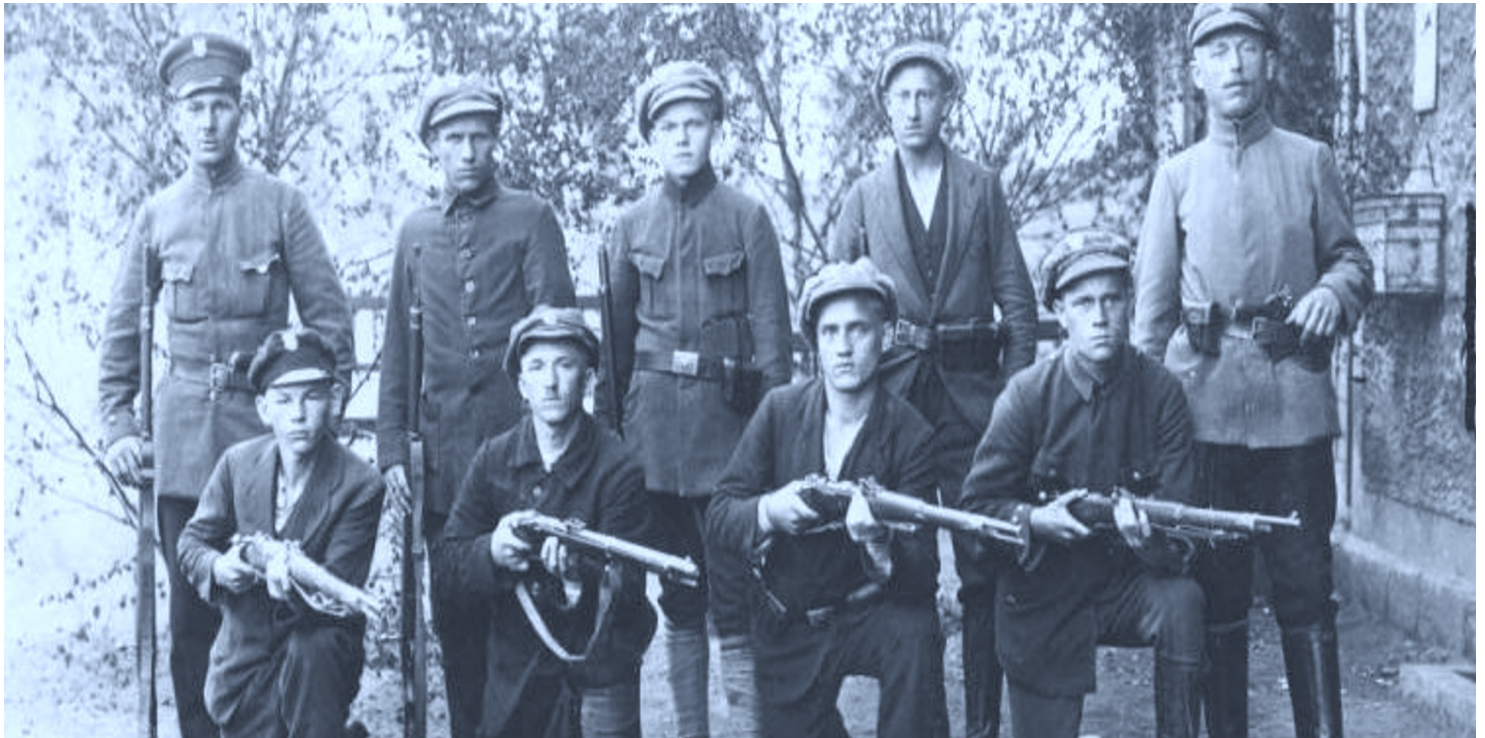
Powstańcy śląscy.

https://przystanekhistoria.pl/pa2/tematy/powstania-slaskie/65721,Odwrot-porucznika-von-Siegroth.html