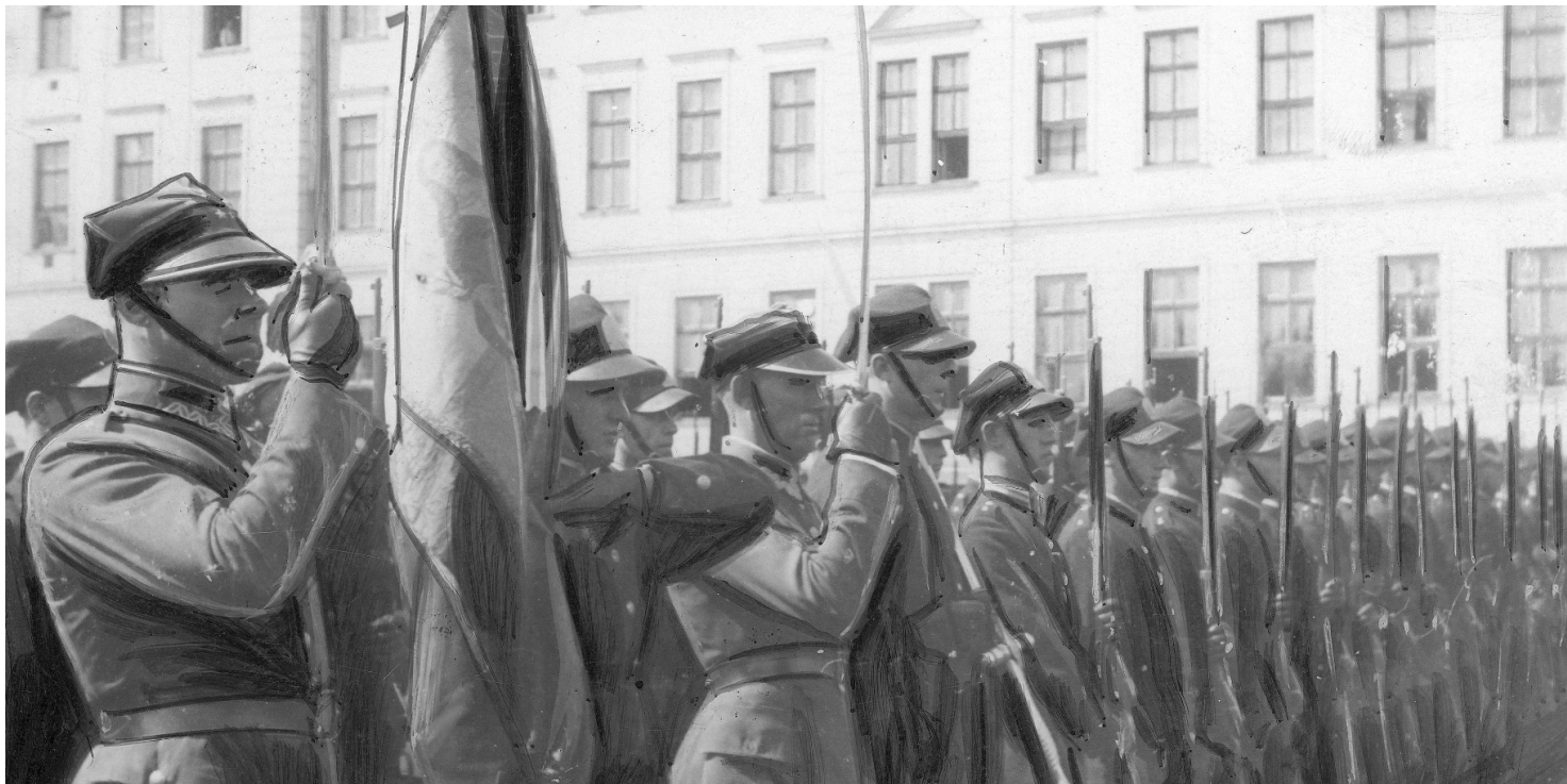
Front oddziału kadetów lwowskich podczas uroczystości, wrzesień 1931 r.

https://przystanekhistoria.pl/pa2/tematy/powstania-slaskie/72222,Polskie-Orleta-na-Slasku-Kadeci-w-powstaniach-slaskich.html