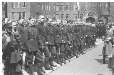
Kadeci podczas uroczystości święta 3 Maja w Katowicach, 1933 r.

dudnią obcasy na kamieni... I nagle ze wszystkich piersi wyrywa się okrzyk, miesza się z wiatrem, ze słońcem, łzy niepowstrzymane płyną po policzkach, niezmierna duma oszałamia zmysły. Obłąkani szczęściem stoimy oto, sponiewierana, śmiejąca się banda niedobitków na kawałku zdobytej Polski.”