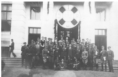
Fotografia grupowa wychowanków Korpusu Kadetów z 1921 r.

Wyszkolenie szeregowego żołnierza piechoty to kwestia kilku tygodni. Wychowanie, uformowanie i wyuczenie dobrego oficera, to kwestia lat i im wcześniej się zacznie, tym lepszy efekt można osiągnąć. Do Korpusów Kadetów, szkół o profilu wojskowym kilkunastoletni chłopcy garnęli się masowo: bywało, że o 1 miejsce starało się 20 chętnych. W pierwszych latach Polsce odrodzonej istniały dwa Korpusy: we Lwowie i w Modlinie. Kadeci Korpusu 1. (przybyli do Lwowa z podkrakowskiego Łobzowa) chodzili po mieście będącym symbolem walki o niepodległość, jedynym polskim mieście odznaczonym Krzyżem Virtuti Militari, lekcje mieli w budynkach o ścianach poznaczonymi śladami kul z czasów tak niedawnej wojny z Ukraińcami. Doskonale rozumieli sens słów Semper Fidelis – Zawsze wierni.