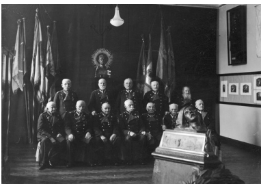
Grupa weteranów 1863 r. podczas otwarcia wystawy

Bili się o niepodległość w Legionach Polskich gen. Jana Henryka Dąbrowskiego, powstałych we Włoszech przy poparciu Francji, a później w czasie wojen napoleońskich. W powstałym w 1815 r. Królestwie Polskim dążyli do zachowania jego autonomii i występowali przeciw łamaniu konstytucji przez carów. Walczyli z Rosją w powstaniu listopadowym i tworzyli Wielką Emigrację. We wszystkich trzech zaborach prowadzili działalność spiskową zmierzającą do wywołania walki powstańczej, która często kończyła się zesłaniem konspiratorów na Syberię bądź uwięzieniem w pruskiej lub austriackiej twierdzy.