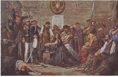
Obraz Jana Matejki Polonia 1863 ( Zakuwana Polska ) w reprodukcji na pocztówce z 1921 r.