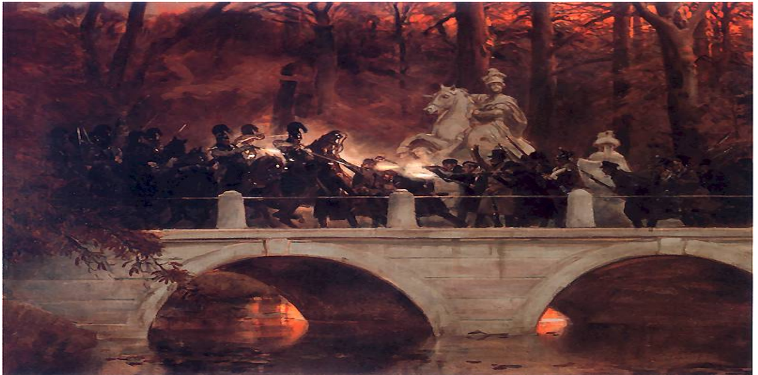
Obraz Wojciecha Kossaka Starcie belwederczyków z kirasjerami rosyjskimi na moście w Łazienkach 29 listopada 1830

https://przystanekhistoria.pl/pa2/tematy/powstanie-styczniowe/97807,Wiek-niewoli.html