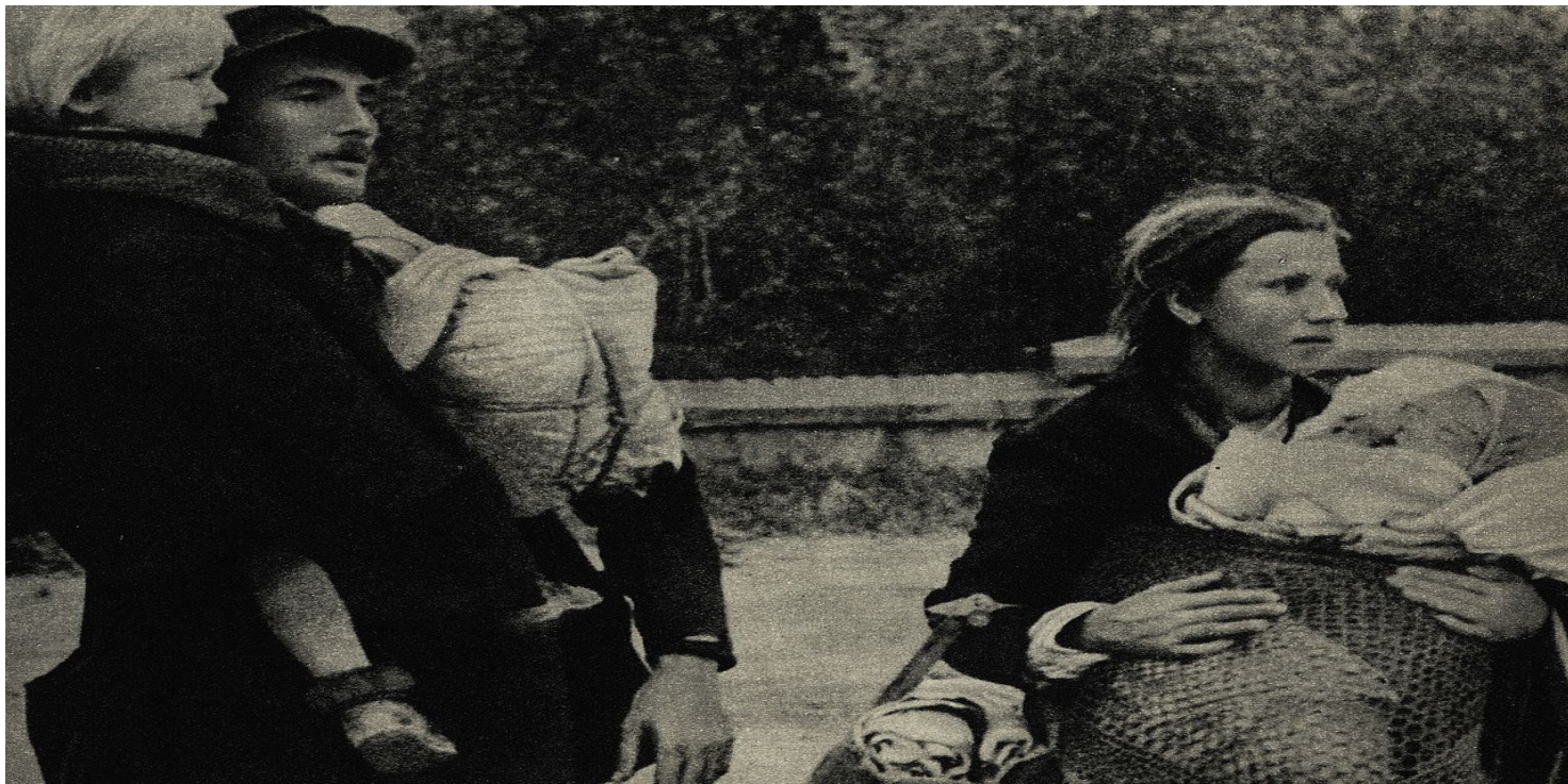
Polscy cywile opuszczający Warszawę podczas rozejmu w trakcie walk powstańczych, 7 września 1944 r. (domena publiczna)

https://przystanekhistoria.pl/pa2/tematy/powstanie-warszawskie/100077,Ciezarne-robotnice-przymusowe-w-obozie-przejsciowym-w-Pile-Durchgangslager-Schne.html