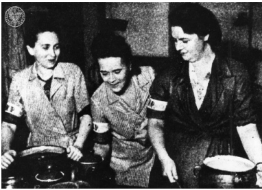
Powstańcza kuchnia polowa.