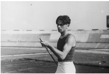
Eugeniusz Lokajski podczas przedolimpijskich zawodów lekkoatletycznych w Warszawie, czerwiec 1936 r.

Eugeniusz Lokajski przed wojną był sportowcem. Odnosił sukcesy jako wszechstronny lekkoatleta. Początkowo startował w zawodach pięcioboju i dziesięcioboju. W 1935 r. zdobył srebrny medal w pięcioboju na mistrzostwach świata w Budapeszcie. Spróbował wszystkiego, aby ostatecznie znaleźć dyscyplinę, w której był najlepszy. W 1936 r. ustanowił rekord Polski w rzucie oszczepem i wystartował w tej konkurencji na olimpiadzie w Berlinie. Na treningu przed zawodami olimpijskimi uzyskał rezultat 73,27 m, co było trzecim, wynikiem na świecie. Niestety kontuzja uniemożliwiła Lokajskiemu zdobycie wtedy medalu.