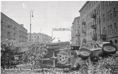
Barykada na ul. Okopowej, 3 sierpnia 1944 r.

W kilka chwil byłyśmy gotowe, „Monika” chwyciła pośpiesznie coś do jedzenia na drogę (zasadniczo każda miała zabrać dla siebie jedzenie na 24 godziny, ale teraz nie było już czasu na wracanie do domu lub kupowanie) i kolejno (konspiracja!) wybiegłyśmy na ulicę.