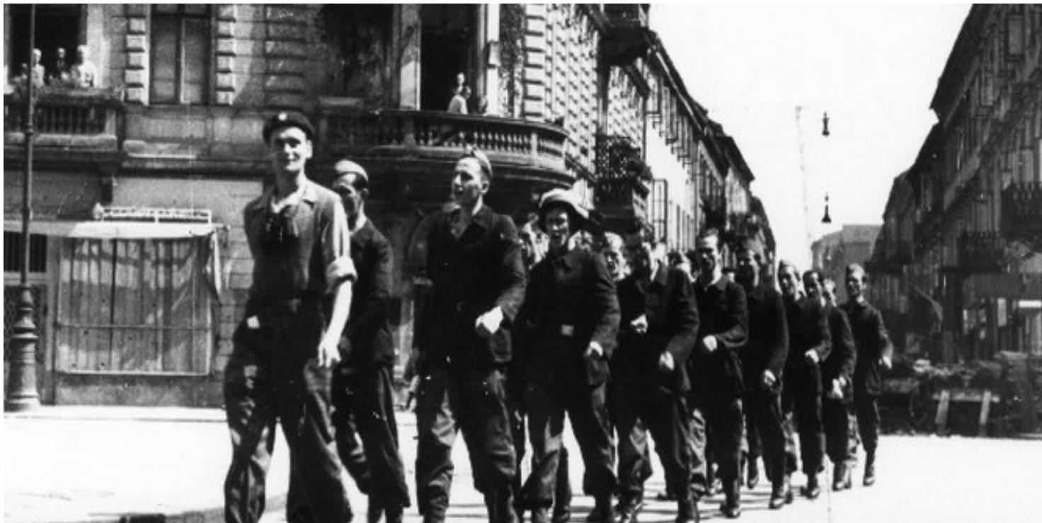
Wymarsz oddziału „Chwatów” w Śródmieściu

https://przystanekhistoria.pl/pa2/tematy/powstanie-warszawskie/72243,Pierwsza-depesza-powstanczej-Warszawy.html