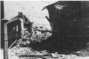
Budynek mieszkalny przy ul. Jasnej zbombardowany przez niemieckie samoloty w czasie Powstania Warszawskiego.

Po dwukrotnej zmianie lokalu mego biura w północnej części Śródmieścia przeszedłem w porozumieniu z kom. Monterem po upadku Powiśla do południowej części, gdzie w lokalu przy ul. Wilczej dotrwałem do kapitulacji. Przede mną przeniosły się na ten teren moje władze centralne oraz wojskowy szef zaopatrzenia, w pobliżu którego musiało się znajdować moje biuro.