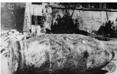
Niewybuch pocisku kal. 600 mm z niemieckiego najcięższego moździerza samobieżnego (60cm Mörser "Karl" Gerät 040, najprawdopodobniej pojazd nr VI