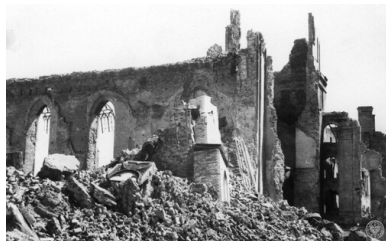
Warszawa, 1945. Ruiny katedry