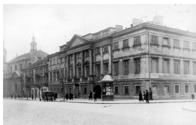
Warszawa, na pierwszym planie siedziba Ministerstwa Sprawiedliwości w Pałacu Raczyńskich przy ul. Długiej 7. Zdjęcie przedwojenne.