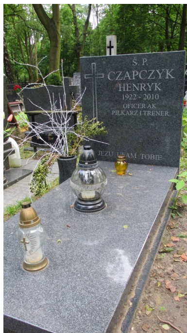
Grób Henryka Czapczyka na cmentarzu jeżyckim przy ul. Nowina w Poznaniu.

Pamięć o znakomitym piłkarzu i powstańcu warszawskim trwa nadal. Pielęgnują ją kibice Lecha, a jedna z trybun na Stadionie Miejskim w Poznaniu nosi imię Henryka Czapczyka. Z tej okazji wmurowano również specjalną tablicę pamiątkową poświęconą temu niezwykłemu człowiekowi.