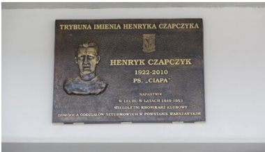
Tablica poświęcona Henrykowi Czapczykowi na Stadionie Miejskim w Poznaniu.