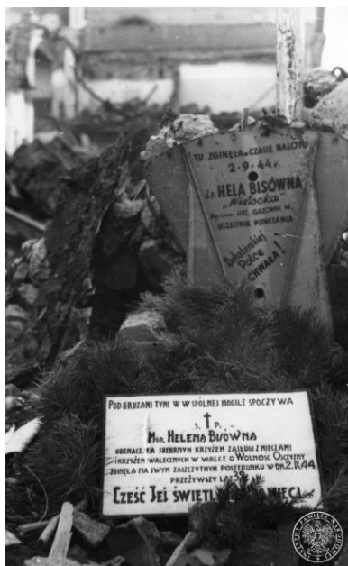
Groby z okresu Powstania. Warszawa, pl. Trzech Krzyży róg Wiejskiej.