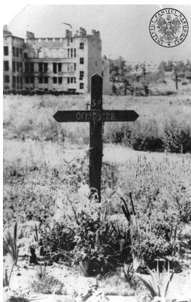
Zbiorowy grób 128 osób