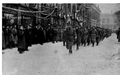
Defilada pierwszych oficerów wielkopolskich podczas uroczystości zaprzysiężenia wojsk powstańczych i wręczenia sztandaru 1 Dywizji Strzelców Wielkopolskich. Poznań, 26 stycznia 1919 r.