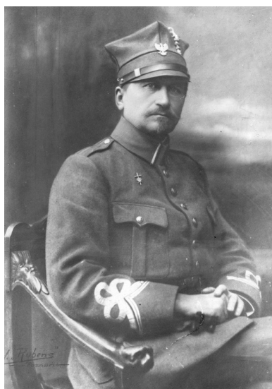
Józef Dowbor-Muśnicki