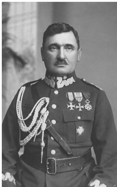
Stanisław Taczak.

dotyczących Powstania Wielkopolskiego, by nie wpadły w ręce Niemców. Najeźdźcy nie oszczędzali pomników i tablic pamiątkowych; nieliczne ocalały, przechowywane przez Polaków pod groźbą aresztowania. W okresie stalinizmu bezpieka próbowała wikłać weteranów w sprawy dywersyjno-polityczne (m.in. w Bydgoskiem), ale spełzło to na niczym.