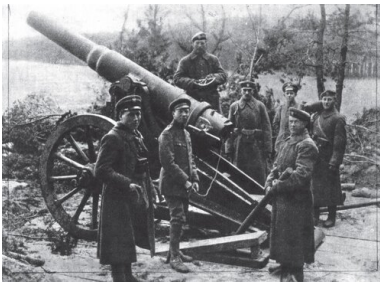
Działo „Barbara” z baterii artylerii ciężkiej na stanowisku pod wsią Zatom Stary k. Międzychodu, luty 1919 r.