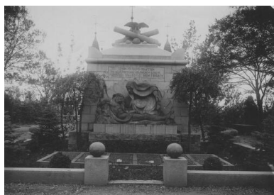
Pomnik Powstańców Wielkopolskich na Cmentarzu Górczyńskim w Poznaniu, 1927 r.

a także udana rzeźba Matki Boskiej Bolesnej pochylającej się nad ciałem Syna.