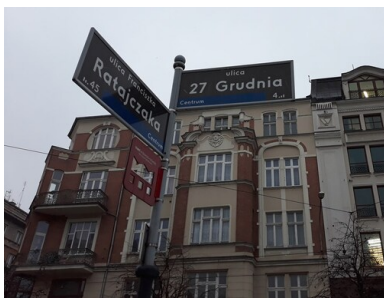
Skrzyżowanie ul. Franciszka Ratajczaka i 27 Grudnia, styczeń 2021 r.