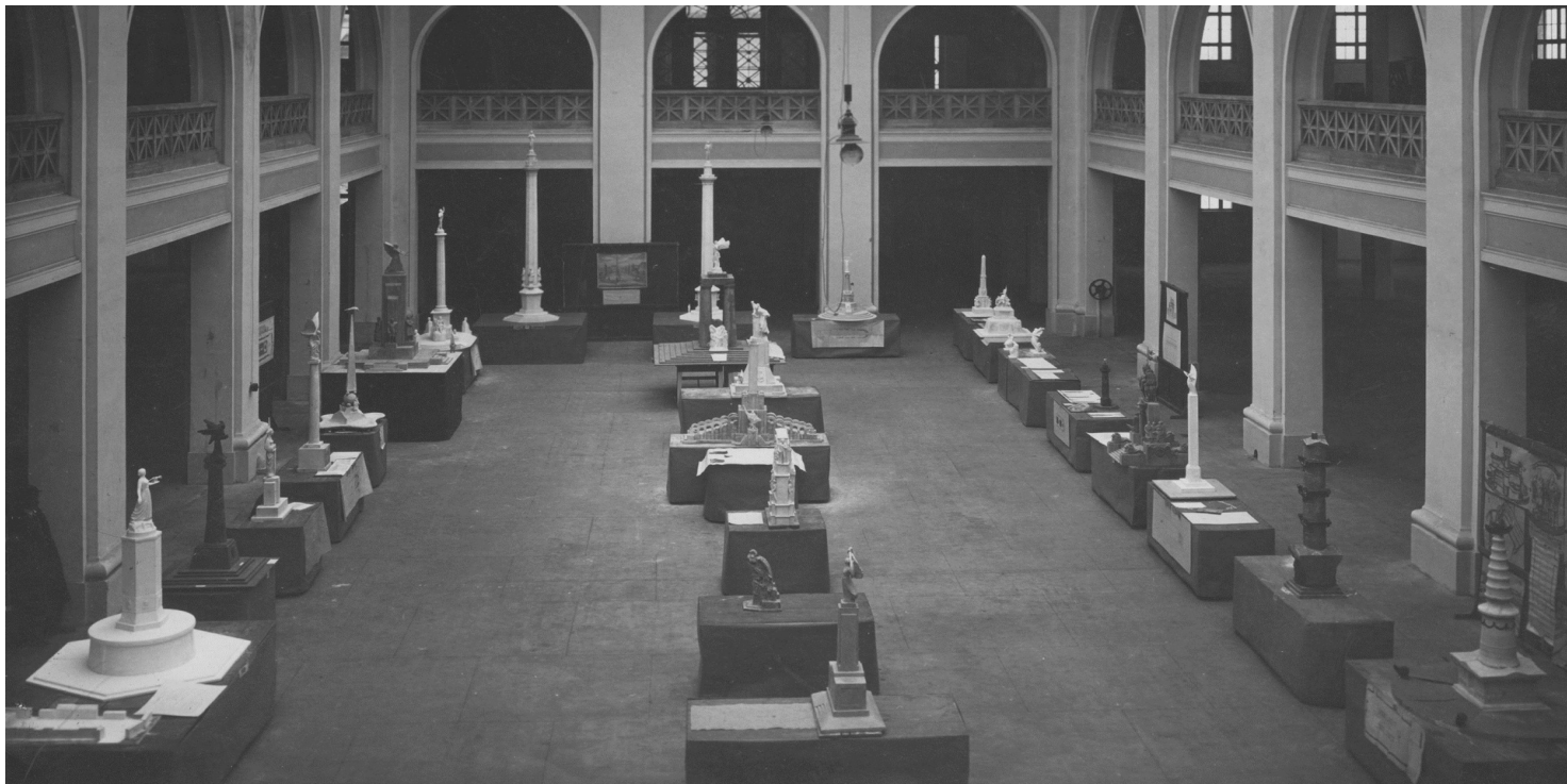
Wystawa prac przygotowanych w konkursie na na projekt pomnika na Placu Wolności w Poznaniu - sala wystawowa Targów Poznańskich, listopad 1927.

https://przystanekhistoria.pl/pa2/tematy/powstanie-wielkopolskie/89581,Miejsca-pamieci-Powstania-Wielkopolskiego.html