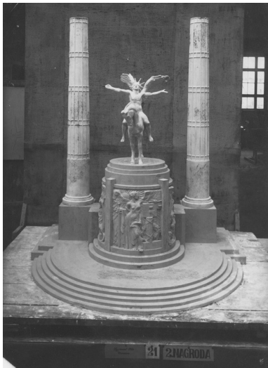
Projekt Pomnika Wolności w Poznaniu (autorstwa artysty rzeźbiarza Zygmunta Otto), który zdobył II nagrodę w konkursie rozstrzygniętym w 1927 r., fot. ze zb. NAC