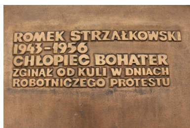
Tablica na narożniku ulic J.H. Dąbrowskiego i Romka Strzałkowskiego.