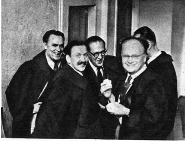
Stanisław Hejmowski podczas procesów poznańskich.