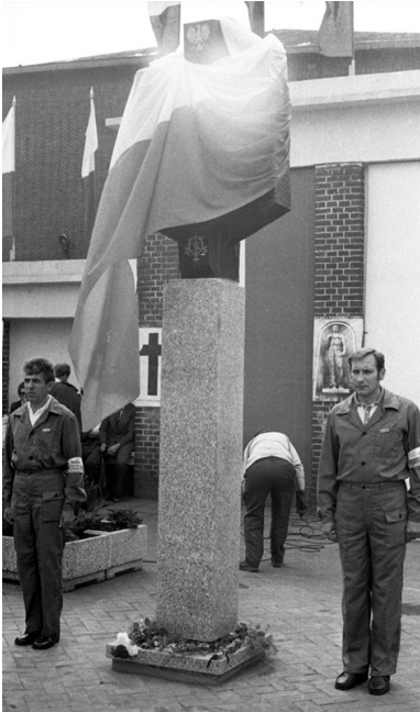
Ceremonia odsłonięcia Czerwcowej tablicy pamiątkowej przed bramą główną HCP, 27 czerwca 1981 r.

27 czerwca 1981 r., w czasie podniosłej uroczystości, odsłonięto tablicę pamiątkową przed bramą główną ZNTK przy ul. Roboczej. Wolnostojąca brązowa tablica wg projektu Józefa Petruka została opatrzona napisem: