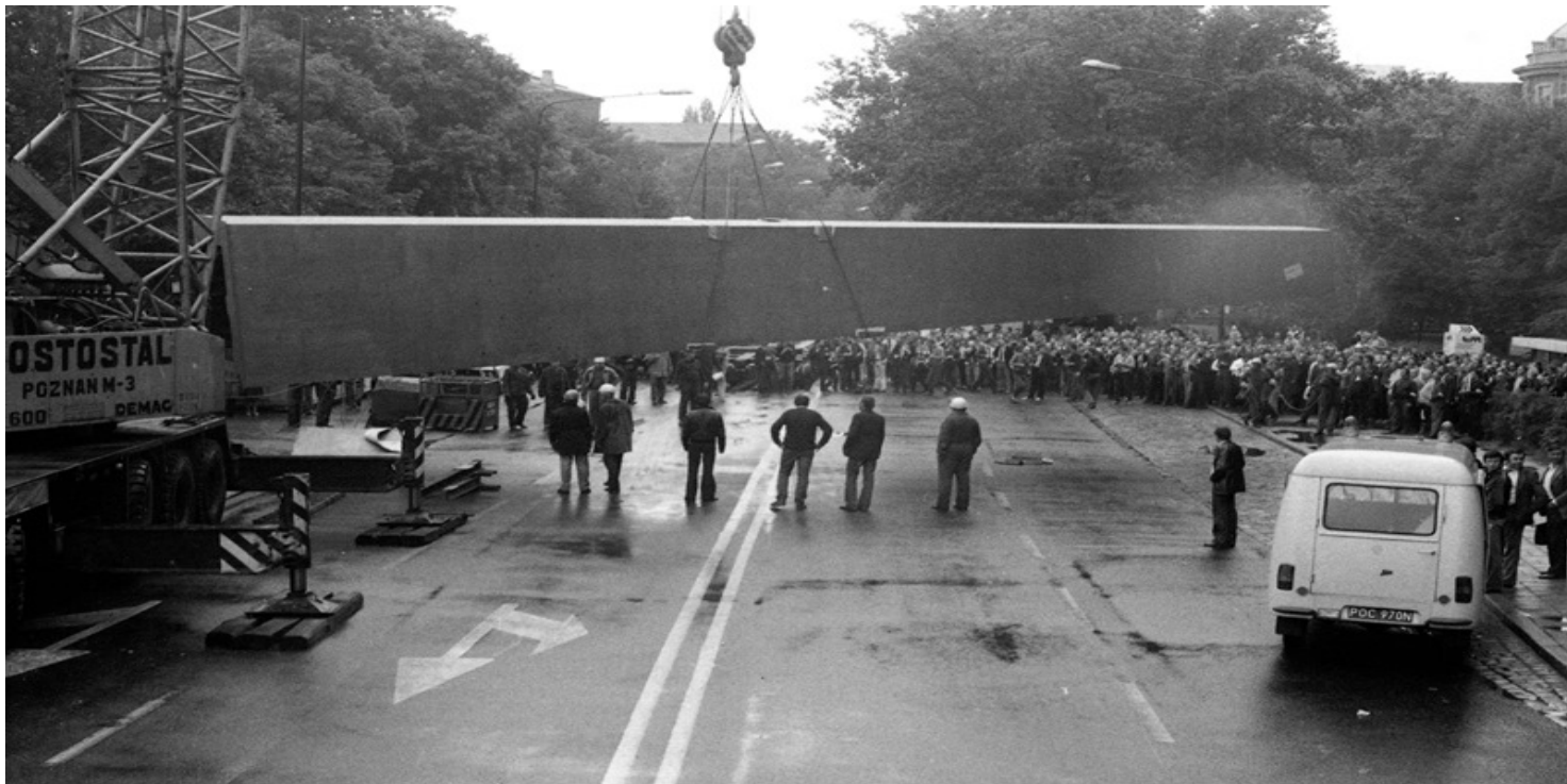
Montaż pomnika Poznańskiego Czerwca 1956 na pl. Mickiewicza, 19 VI 1981 r.

https://przystanekhistoria.pl/pa2/tematy/poznanski-czerwiec-56/92863,Poznanski-Czerwiec-1956-Miejsca-pami-eci.html