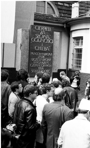
Uroczystość odsłonięcia tablicy pamiątkowej przed bramą główną ZNTK (ul. Robocza) z okazji 25. rocznicy Poznańskiego Czerwca 1956, 27 czerwca 1981 r.

Kolejną tablicą pamiątkową jest ta odsłonięta również 27 czerwca 1981 r. przed bramą główną zajezdni tramwajowej MPK przy ul. Gajowej. Zawieszona na konstrukcji wykonanej z tramwajowych szyn i odlana w żeliwie płyta zawiera fragment pomnikowego wiersza mieszkającej przez wiele lat po drugiej stronie ulicy Kazimiery Iłakowiczówny: