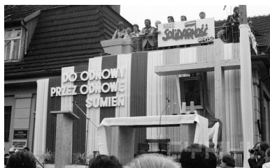
Uroczystość odsłonięcia tablicy pamiątkowej przed bramą główną ZNTK (ul. Robocza) z okazji 25. rocznicy Poznańskiego Czerwca 1956, 27 czerwca 1981 r.