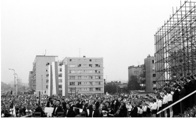
Ceremonia odsłonięcia Czerwcowej tablicy pamiątkowej przed bramą główną HCP, 27 czerwca 1981 r.