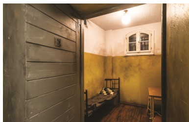
Zrekonstruowana cela więzienna, w której przetrzymywano uczestników Poznańskiego Czerwca.

Z ulic można przejść do kolejnych pomieszczeń. Prezydialna sala Komitetu Wojewódzkiego Polskiej Zjednoczonej Partii Robotniczej wypełniona propagandowymi plakatami, Wojewódzki Urząd ds. Bezpieczeństwa Publicznego z symboliczną salą przesłuchań, celą i sądem – wszystkie te miejsca tworzą spójną opowieść o Czerwcu '56. Twórcom ekspozycji przyznano Grand Prix i statuetkę „Izabelli” w konkursie na wydarzenie muzealne roku 2007 w Wielkopolsce 10 .