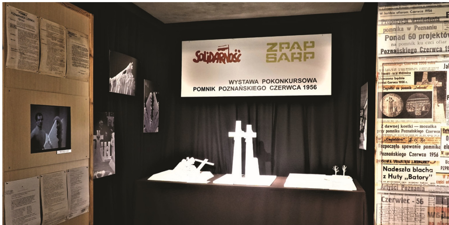
Projekty zgłoszone w konkursie na Pomnik Poznańskiego Czerwca 1956.

https://przystanekhistoria.pl/pa2/tematy/poznanski-czerwiec-56/92990,Swiadectwo-ocalonej-pamieci-Muzeum-Powstania-Poznanskiego-Czerwiec-1956-r.html