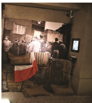
Muzeum Powstania Poznańskiego - Czerwiec 1956; fragment

Wraz z narodzinami III RP można było zacząć jawnie i głośno mówić o poznańskim roku 1956. Wówczas też coraz częściej zaczęto zwracać uwagę na to, że mimo obecności w przestrzeni miejskiej pomników oraz podejmowania działań upamiętniających Czerwiec '56 nadal brakuje miejsca, w którym można by poznać i przeżyć historię „czarnego czwartku”. Uczestnicy wydarzeń zgodnie uważali, że najwłaściwszą formą upamiętnienia ich nierównej walki z komunistami byłoby muzeum.