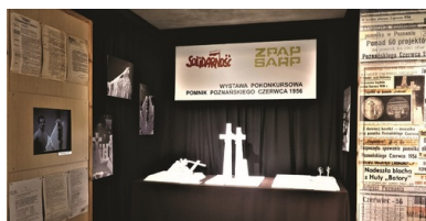
Projekty zgłoszone w konkursie na Pomnik Poznańskiego Czerwca 1956.

Po przekroczeniu progu muzeum znajdujemy się w mieszkaniu typowej poznańskiej rodziny z lat pięćdziesiątych XX w., dla której pielęgnowanie tradycji i pamięci o przodkach było wartością samą w sobie. Twórcom ekspozycji zależało na tym, aby pokazać, że walka o polskość toczyła się przede wszystkim za zamkniętymi drzwiami mieszkania. Poczucie własnej tożsamości skonfrontowane z niesprawiedliwością i wyzyskiem dało swój wyraz 28 czerwca 1956 r. na ulicach Poznania.