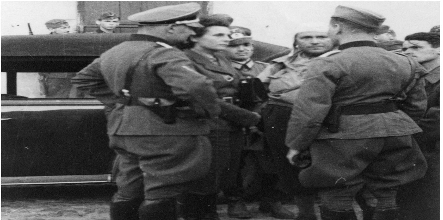
Leni Riefenstahl i towarzyszący jej członkowie ekipy rozmawiają z niemieckimi oficerami, prawdopodobnie po przybyciu do miasta. Końskie, 12 IX 1939 r.

https://przystanekhistoria.pl/pa2/tematy/propaganda/101247,Romans-kina-i-swastyki.html