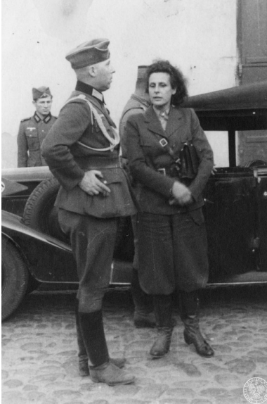
Reżyserka Leni Riefenstahl rozmawia z niemieckim oficerem, prawdopodobnie po przybyciu do miasta. Końskie, 12 IX 1939 r.

Innym ważnym filmem w twórczości Riefenstahl był reportaż, a w zasadzie kronika, z olimpiady w Berlinie w 1936 r., zatytułowany „Olympia”. W dokumencie tym reżyserka zastosowała wiele nowatorskich technik filmowych – wykorzystała różne rodzaje kamer, obiektywów i filtrów, by zarejestrować ruch człowieka. Kręciła także ujęcia w zwolnionym tempie. Pracowała w trudnych warunkach, co wymagało od niej jeszcze większej pomysłowości.