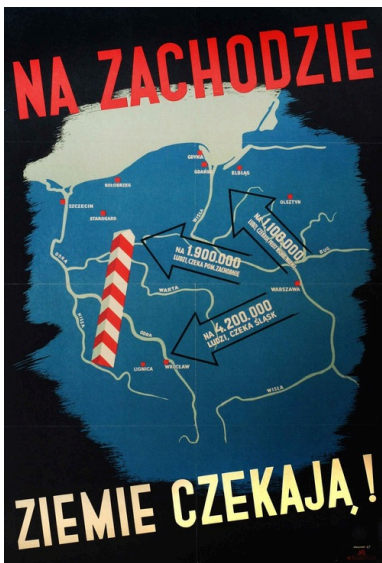
Plakat propagandowy Mieczysława Teodorczyka „Na zachodzie ziemie czekają!”, 1945 r. (zbiory Muzeum Niepodległości w Warszawie)

Wspomniane akcje wysiedleńcze (zwane eufemistycznie „repatriacją” lub „ewakuacją”) teoretycznie były dobrowolne, w praktyce jednak dobrowolność ta bywała fikcyjna. Wysiedleńcy z Kresów Wschodnich mogli wziąć ze sobą odzież, obuwie, bieliznę, pościel, żywność, pomniejsze sprzęty domowe, inwentarz, ale nie mogli zabrać mebli, pieniędzy (powyżej 1000 rubli na osobę), złota, surowych kamieni szlachetnych, dzieł sztuki, a także samochodów. Za mienie pozostawione w rodzinnych stronach mieli uzyskać zwrot wartości od polskiego rządu.