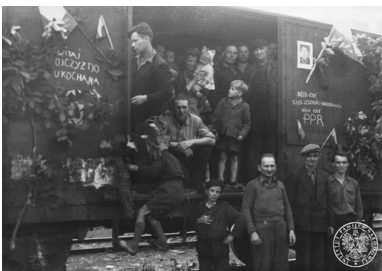
Wagon z ludźmi na jednej ze stacji kolejowych. Fotografia z albumu Państwowego Urzędu Repatriacyjnego, 1945-1946 r.

W lipcu 1944 r., w czasie postępującej ofensywy Armii Czerwonej na zachód, Polski Komitet Wyzwolenia Narodowego zawarł z Moskwą umowę dotyczącą granicy polsko-sowieckiej. Umowa ta, podpisana wbrew legalnemu polskiemu rządowi w Londynie, sankcjonowała utratę wschodnich ziem RP na rzecz ZSRS jeszcze przed formalnymi decyzjami podjętymi przez wielkie mocarstwa na kolejnej konferencji – w Jałcie.