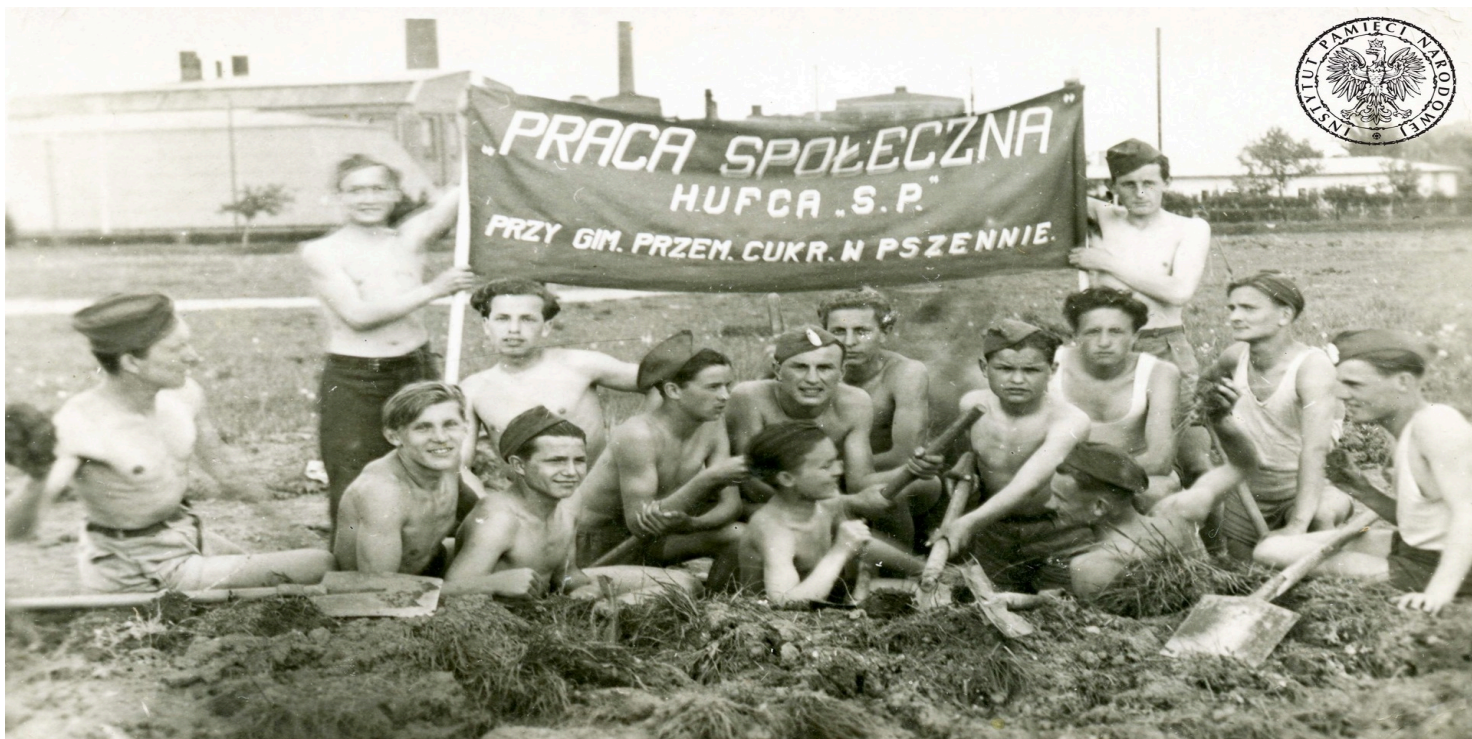
Junacy hufca Powszechnej Organizacji „Służba Polsce” działającego przy Gimnazjum Przemysłowym Cukrowni „Świdnica” w Pszenniu, b.d. Kopia cyfrowa zdjęcia przekazana do zasobu IPN przez p. Piotra Kraśnianina (fot. z zasobu IPN)

https://przystanekhistoria.pl/pa2/tematy/propaganda/105781,Powszechna-Organizacja-Sluzba-Polsce.html