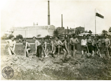
Junacy hufca Powszechnej Organizacji „Służba Polsce” działającego przy Gimnazjum Przemysłowym Cukrowni „Świdnica” w Pszennie, b.d. Kopia cyfrowa zdjęcia przekazana do zasobu IPN przez p. Piotra Kraśnianina (fot. z zasobu IPN)