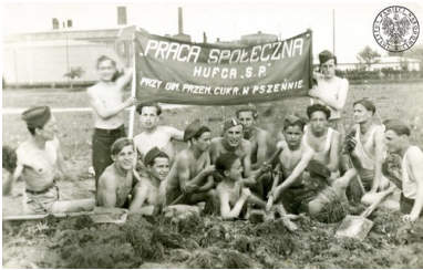
Junacy hufca Powszechnej Organizacji „Służba Polsce” działającego przy Gimnazjum Przemysłowym Cukrowni „Świdnica” w Pszennie, b.d. Kopia cyfrowa zdjęcia przekazana do zasobu IPN przez p. Piotra Kraśnianina (fot. z zasobu IPN)