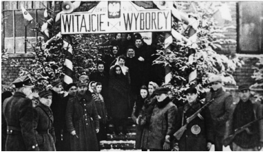
Wejście do lokalu wyborczego w Sanoku, 19 I 1947 r.

Według oficjalnych danych PPR i jej satelici uzyskali 80,1 proc. głosów przy zaledwie 10,3 proc. PSL-u. „Wybory to taka szkatułka: wchodzi Mikołajczyk – wychodzi Gomułka” – powtarzali ci, którzy nie mieli wątpliwości, co działo się 19 stycznia.