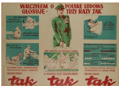
Przedreferendalna ulotka propagandowa