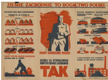
Plakat wzywający do głosowania za utrwaleniem nowych granic zachodnich

Pytania były skonstruowane w taki sposób, że trudno było odpowiedzieć na nie przecząco. Widoczne to było szczególnie w trzecim pytaniu, ponieważ przy postanowionej kwestii granic zachodnich zupełnie pomijano milczeniem sprawę granic wschodnich. Z kolei pierwsze pytanie stanowiło pułapkę zastawioną na Polskie Stronnictwo Ludowe, które w swoim programie postulowało zniesienie Senatu. Aby nie sprawiać wrażenia, że PSL sprzymierza się z komunistami i nie przysparza głosów PPR i jej satelitom, Stronnictwo zdecydowało się wezwać obywateli do głosowania „nie” na pierwsze pytanie. Z kolei podziemne Zrzeszenie „Wolność i Niezawisłość” postulowało odrzucenie dwóch pierwszych pytań, a środowiska związane z Narodowymi Siłami Zbrojnymi wszystkich trzech.