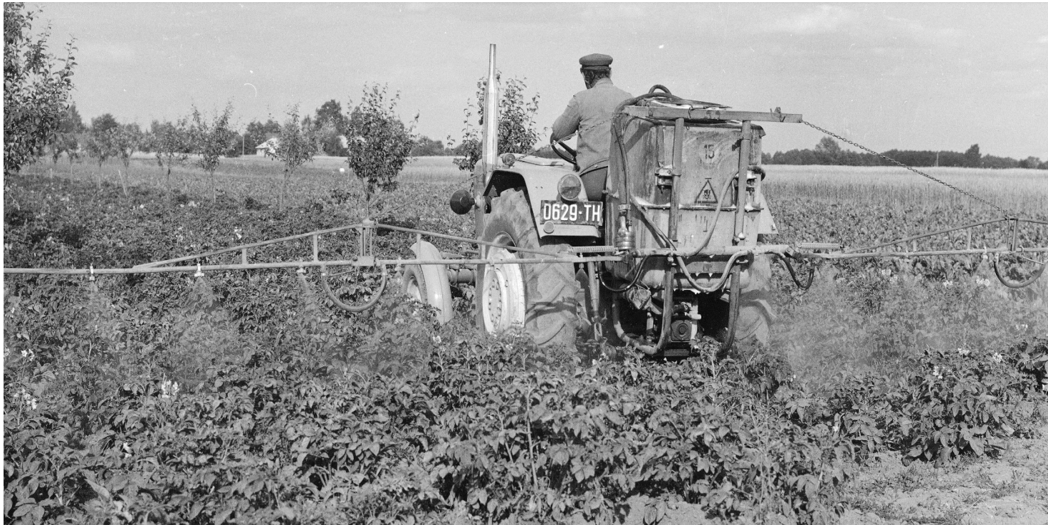
Oprysk ziemniaków przeciwko stonce ciągnikiem Ursus C-330 z opryskiwaczem polowym, 1976 r.

https://przystanekhistoria.pl/pa2/tematy/propaganda/76454,Z-Kolorado-do-Polski-ludowej-Inwazja-stonki-ziemniaczanej.html