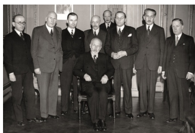
Rząd Tomasza Arciszewskiego,

Wizję powojennej demokratycznej Polski sformułowano w deklaracji programowej „O co walczy naród polski”, przyjętej 15 marca 1944 r. przez Radę Jedności Narodowej – podziemny parlament utworzony 9 stycznia 1944 r. Zgodnie z tą deklaracją granice państwa polskiego na zachodzie i północy miały być poszerzone o całe Prusy Wschodnie i Gdańsk, ziemie położone na wschód od Odry i Śląsk Opolski. Na wschodzie zaś miała pozostać granica ustalona w traktacie ryskim w 1921 r. Zapewniano przy tym pełne równouprawnienie polityczne oraz swobodny rozwój kulturalny, gospodarczy i społeczny mniejszości narodowych. Odrodzone państwo polskie miało być w pełni suwerenne i opierać swoją politykę zagraniczną na ścisłym sojuszu z Wielką Brytanią, Stanami Zjednoczonymi, Francją i Turcją oraz na ścisłej współpracy z innymi krajami sprzymierzonymi. Przewidywano także unormowanie stosunków ze Związkiem Sowieckim „pod warunkiem uznania z jego strony integralności przedwojennego terytorium Rzeczypospolitej oraz zasad nieingerowania w sprawy wewnętrzne”.