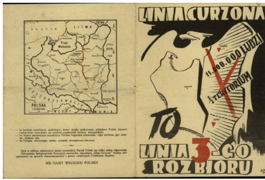
Okładka (ostatnia i pierwsza strona) polskiej ulotki wojennej Linia Curzona to linia 3-go rozbioru