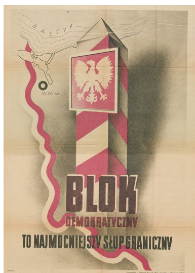
Plakat wyborczy tzw. Bloku Demokratycznego

21 lipca 1944 r. z inicjatywy Józefa Stalina powstał w Moskwie Polski Komitet Wyzwolenia Narodowego, który jako namiastka rządu zainstalował się kilka dni później w Lublinie. 22 lipca PKWN wydał swój „Manifest”, w którym stwierdzono, że „Krajowa Rada Narodowa, powołana przez walczący naród, jest jedynym legalnym źródłem władzy w Polsce”. Według „Manifestu”, KRN, do której weszli „reprezentanci stronnictw demokratycznych”, powołała PKWN jako „legalną tymczasową władzę wykonawczą dla kierowania walką wyzwolenczą narodu, zdobycia niepodległości i odbudowy państwowości polskiej”. Oba te twory, KRN i PKWN, działały rzekomo na podstawie Konstytucji z 17 marca 1921 r., jako „jedynie obowiązującej konstytucji legalnej”. Prawowity Rząd RP w Londynie określono mianem władzy „samozwańczej” i „nielegalnej”, opartej na rzekomo faszystowskiej Konstytucji kwietniowej. Organizację władzy w Polsce zamierzano oprzeć na zaczerpniętym od Sowieców systemie rad narodowych. Deklarowano uroczyście przywrócenie swobód demokratycznych, które nie miały jednak służyć „wrogom demokracji”. W dziedzinie gospodarki manifest zapowiadał odbudowę zniszczeń, zwrot własności zagrabionej przez okupanta i reformę rolną. W sprawie granic ogłoszono przyłączenie Pomorza i Śląska Opolskiego do Polski oraz obiecywano „polskie słupy graniczne na Odrze”, a na wschodzie enigmatyczną „linię przyjaznego sąsiedztwa”.