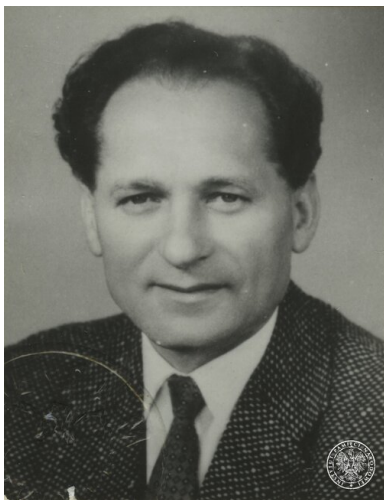
Mieczysław Moczar, członek KPP, PPR i PZPR.

Po uchwaleniu konstytucji komuniści zadekretowali swój monopol na sprawowanie władzy politycznej poprzez uchwalenie w sierpniu 1952 r. ordynacji wyborczej przewidującej, że liczba kandydatów miała być równa liczbie posłów.