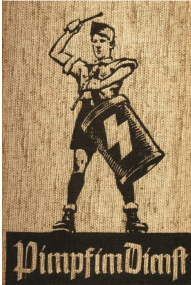
Okładka podręcznika dla Deutsches Jungvolk Pimpf im Dienst , Poczdam 1938 (domena publiczna)

nauka w szkole wyższego stopnia). Ponad dwieście stron zajęły wytyczne dla szkół męskich, a piętnaście – dla żeńskich. Słowo „Lehrer” (nauczyciel) zastąpiono określeniem „Volkserzieher” (pedagog ludowy).