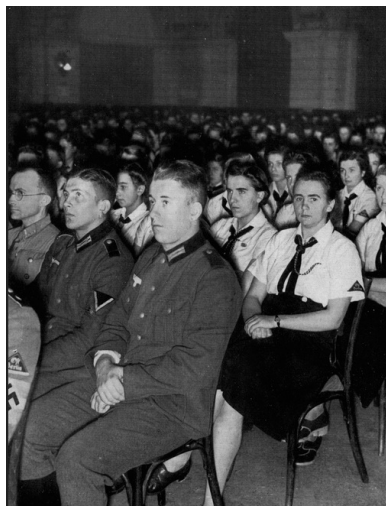
Zebranie dziewcząt ze Związku Dziewcząt Niemieckich (BDM) i członków Hitlerjugend pełniących służbę wojskową, 1940 r.

– głosił zamieszczony na wstępie list przywódcy Młodzieży Rzeszy NSDAP Baldura von Schiracha, skazanego w głównym procesie zbrodniarzy wojennych przed Międzynarodowym Trybunałem Wojskowym w Norymberdze na dwadzieścia lat więzienia.