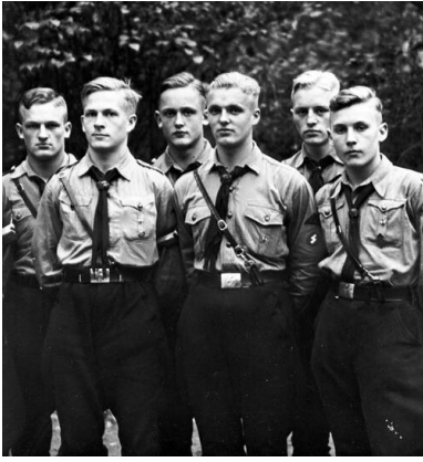
Wybrani przez Urząd Polityki Rasowej chłopcy z Hitlerjugend, 1933 r.