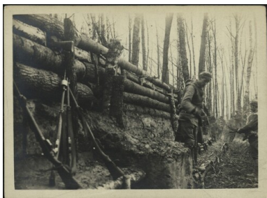
Legioniści w okopach pod Kostiuchnówką, 1916.