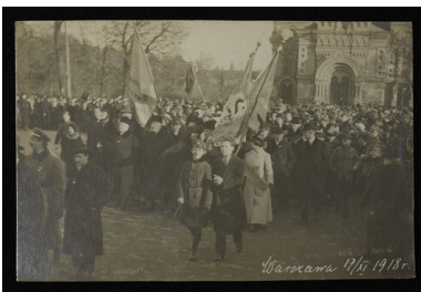
Manifestacja patriotyczna - wielki

10 listopada 1918 r. do Warszawy przybył Józef Piłsudski, przed którym klęska państw centralnych otworzyła bramy więzienne. Powrót komendanta I Brygady Legionów do kraju zbiegł się z zawieszeniem broni między Niemcami a ententą 11 listopada, które zakończyło I wojnę światową i równocześnie okazało się początkiem tworzenia polskiej państwowości. Jednak nie był to proces łatwy.