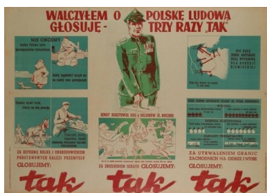
Przedreferendalna ulotka propagandowa