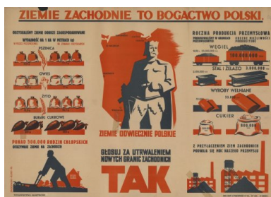
Plakat wzywający do głosowania za utrwaleniem nowych granic zachodnich

Pytania były skonstruowane w taki sposób, że trudno było odpowiedzieć na nie przecząco. Widoczne to było szczególnie w trzecim pytaniu, ponieważ przy postanowionej kwestii granic zachodnich zupełnie pomijano milczeniem sprawę granic wschodnich. Z kolei pierwsze pytanie stanowiło pułapkę zastawioną na Polskie Stronnictwo Ludowe, które w swoim programie postulowało zniesienie Senatu. Aby nie sprawiać wrażenia, że PSL sprzymierza się z komunistami i nie przysparza głosów PPR i jej satelitom, Stronnictwo zdecydowało się wezwać obywateli do głosowania „nie” na pierwsze pytanie. Z kolei podziemne Zrzeszenie „Wolność i Niezawisłość” postulowało odrzucenie dwóch pierwszych pytań, a środowiska związane z Narodowymi Siłami Zbrojnymi wszystkich trzech.