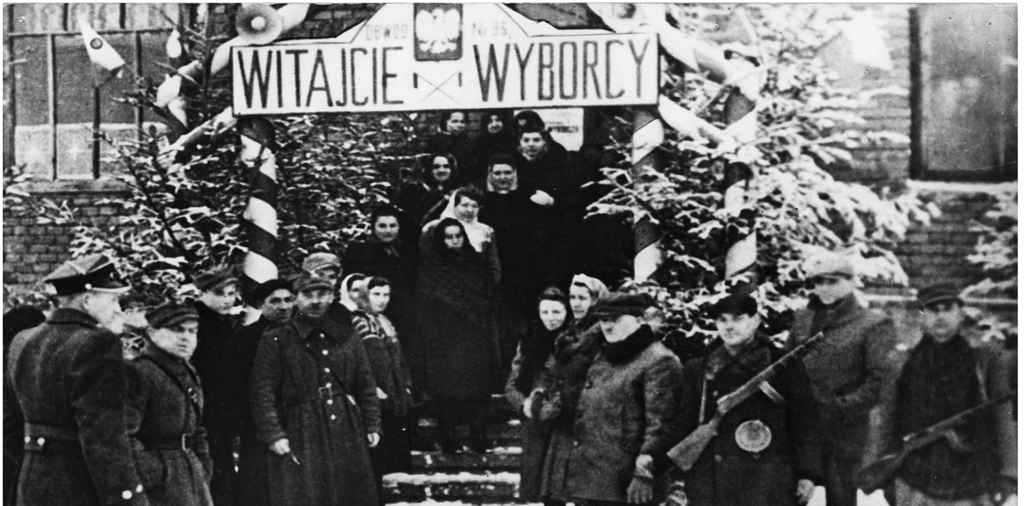
Wejście do lokalu wyborczego w Sanoku, 19 I 1947 r.

https://przystanekhistoria.pl/pa2/tematy/referendum-1946/89092,Polacy-glosuja-PPR-decyduje.html