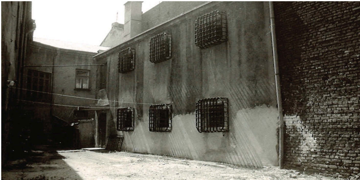
Areszt miejski w Radomsku, z którego dwukrotnie uwalniano więźniów

https://przystanekhistoria.pl/pa2/tematy/represje/101190,Dowodca-akcji-na-Radomsko-Porucznik-Jan-Rogulka-Grot-19131946.html