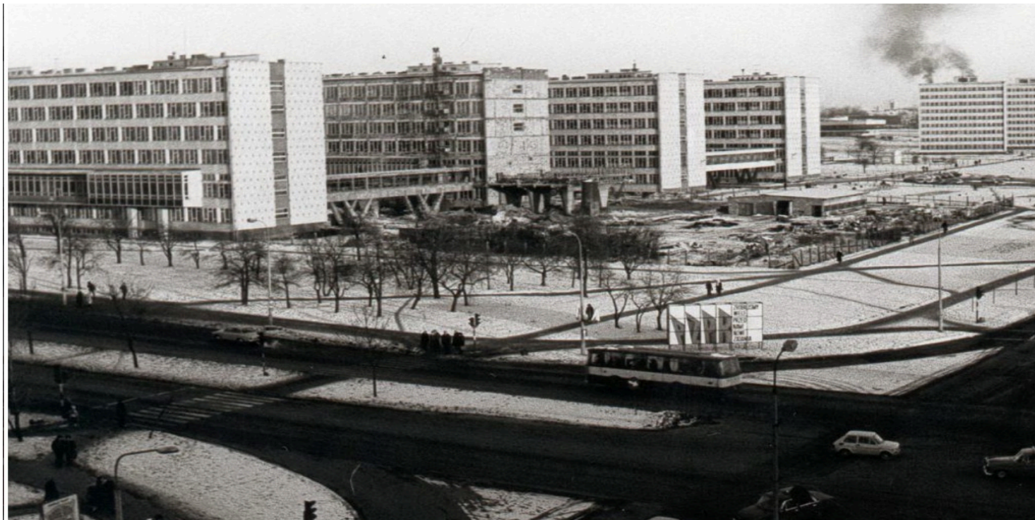
Politechnika Świętokrzyska w okresie PRL

https://przystanekhistoria.pl/pa2/tematy/represje/101260,Utrata-przez-Politechnike-Swietokrzyska-takiej-klasy-dydaktyka-jest-wielce-niepo.html