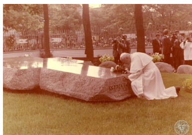
Trzecia pielgrzymka Jana Pawła II do Polski, 14 czerwca 1987. Ojciec Święty modli się przed grobem księdza Jerzego Popiełuszki na terenie kościoła św. Stanisława Kostki w Warszawie.

Nie udało się wreszcie szantaż wobec Kościoła – propagandowa nagonka nie doprowadziła do rezygnacji ze społecznego zaangażowania tych kapłanów, którzy wspierali „Solidarność”. Natomiast akcja zmierzająca do usuwania z sal szkolnych krzyży wywołała zdecydowane protesty, z najgłośniejszym, do którego doszło w Miętnej koło Garwolina. Siły rządowe nie zapobiegły też demonstracjom, do których doszło 1 i 3 maja (podczas wystąpień pierwszomajowych zatrzymano, według oficjalnych danych, blisko 700 osób).